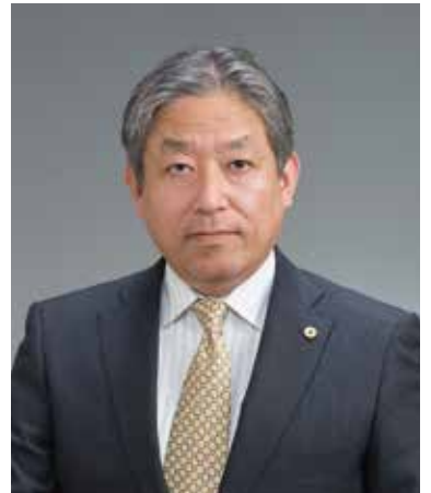
浦山社会保険労務士事務所 特定社会保険労務士