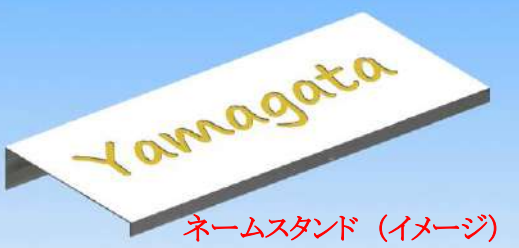
ネームスタンド (イメージ)